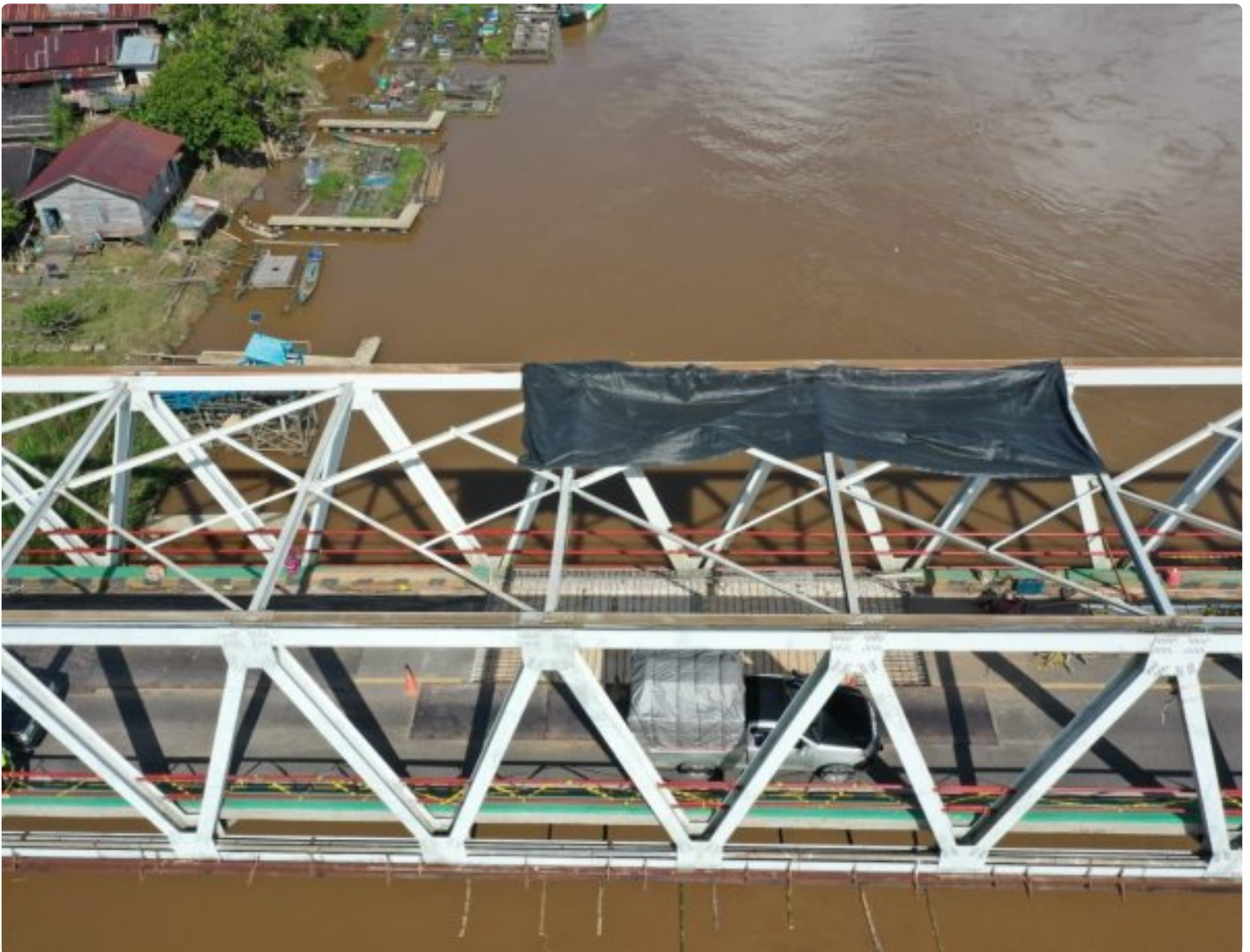
Jembatan Kasongan (Sei Katingan) Dalam Proses Perbaikan Oleh BPJN Kalimantan Tengah

KATINGAN - Penutupan jembatan Sei Katingan atau jembatan Kasongan, Kabupaten Katingan yang direncanakan akan ditutup pada tanggal 27 Maret 2023, akan diundur dua hari yaitu pada tanggal 29 Maret 2023.